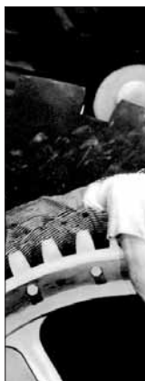
Raus aus der Tretmühle: Hätte Charlie Chaplin »Moderne Zeiten« gedreht, wenn er ein Grundeinkommen bezogen hätte?